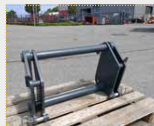
Adapterrahmen Weidemann hydr. / Schäffer SWR

Lagermaschine Bj. 2022; Fahrzeugaufnahme Weidemann Hoflader; Geräteaufnahme Schäffer SWR; Farbschäden