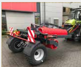
Cambridgewalze CB 620 DL

Lagermaschine Bj. 2023, leichte Farbschäden, Arbeitsbreite: 6,2 m, Transportbreite: 2,55 m, hydraulisch klappbar (2 x dw erforderlich), 3-teilige Walze mit liegenden Walzenelementen, Fahrwerk mit Rädern 15,0/55-17, LED-Beleuchtungsanlage inkl. Warntafeln, 2-Kreis Druckluftbremse, Zugdeichsel mit Unterlenkerbolzen Kat. III (Spreizmaß Kat. II)