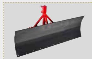
RS 2200 / RS 2500 Räumschild

Lagermaschine Bj. 2023; Dreipunktaufnahme Kat. I/II; Räumbreite 2.200 / 2.500 mm; Schildhöhe 710 mm; Farbschäden