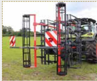
Großfederzinkenegge AllStar Profi 501

Lagermaschine Bj. 2023, leichte Farbschäden, Arbeitsbreite: 5,0 m, Gewicht: 1.670 kg, 70x12 Herkuleszinken + Schmalschar, einfach Krümmerwalze, serienmäßige Beleuchtung