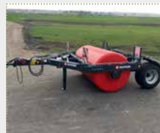
Wiesenwalze Robust 301 FG

Lagermaschine Bj. 2022, leichte Farbschäden, Arbeitsbreite: 2,93 m, mit Fahrgestell, gefederter Abstreifer, Mitteltrennwand als Schwallschutz, Spindel-Abstellstütze, gefederter Abstreifer, Pendelrollenlager, Wassereinfüllstutzen, Trommel-Ø: 123 cm, seitliche Bremsringe für hydraulische Bandbremse, Beleuchtungsanlage LED inkl. Warntafeln