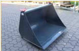
LG 13 Weidemann mech. Leichtgutschaufel

Lagermaschine Bj. 2024; Fahrzeugaufnahme Weidemann U-Profil mechanisch; Breite 1.300 mm; Inhalt 490 l gestrichen nach DIN; Inhalt 640 l gehäuft nach SAE; Farbschäden