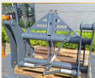
Adapterrahmen Claas Scorpion / Volvo L70

Lagermaschine Bj. 2023; Fahrzeugaufnahme Claas Scorpion/Kramer KT; Geräteaufnahme Volvo L70-L120/JCB/Claas/CAT/Liebherr; Farbschäden