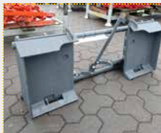
Adapterrahmen DIN 24410 / Euro

Lagermaschine Bj. 2023; Fahrzeugaufnahme DIN 24410/SkidSteer; Geräteaufnahme Euro; Farbschäden