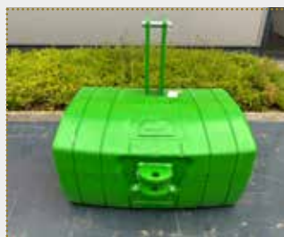
Stahlbetongewicht NG 400 kg

Lagermaschine Bj. 2023, JD grün; Dreipunktanbau Kat. II; Rangierkupplung; Farbschäden