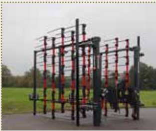
Strohstriegel ClearStar 600 inkl. Impulsschiene

Lagermaschine Bj. 2023, leichte Farbschäden, Arbeitsbreite: 6,0 m, Gewicht: 1.750 kg, hydraulische Zinkenverstellung, Impulsschiene, Beleuchtungsanlage serienmäßig