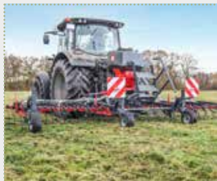
Exaktstriegel Perfekt ES 600 mit Kleinsamenstreuer DrillStar 300E

Schulungsmaschine Bj. 2023; Arbeitsbreite: 6,0 m; Ø10 mm Zinken; federbelastete Impulsschiene; Beleuchtungsanlage inklusive Warntafeln; Aufbauodest für SAPHIR DrillStar; Kleinsamenstreuer DrillStar 300E (elektrisch)