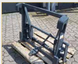
Adapter Merlo ZM3 / Euro

Lagermaschine Bj. 2023; Fahrzeugaufnahme Merlo ZM3; Geräteaufnahme Euroaufnahme; Farbschäden