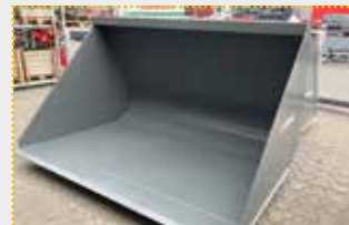
LG XL 24 Claas/Kramer Leichtgutschaufel

Lagermaschine Bj. 2023; Fahrzeugaufnahme Teleskopklader Claas & Kramer; Breite 2.400 mm; Inhalt 2.450 l gestrichen nach DIN; Inhalt 3.060 l gehäuft nach SAE; Sonderlackierung