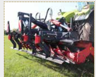
Front/Heck Messerwalze SinusCut 500 inkl. Impulsschiene

Vorführmaschine Bj. 2023, Farbschäden, Arbeitsbreite: 5,0 m, Gewicht: 1.500 kg, Impulsschiene, serienmäßige Begrenzungsleuchten inkl. Warntafeln