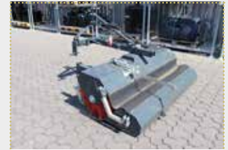
FKM 151 Kehrmaschine

Vorführmaschine Bj. 2023; Dreipunktaufnahme Kat. I/II; Arbeitsbreite 1.500 mm; Gesamtbreite 1.850 mm; Bürstendurchmesser 520 mm; Farbschäden