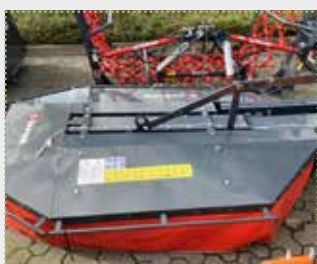
Kreiselmäherwerk KM 166

Lagermaschine Bj. 2022, leichte Farbschäden, Arbeitsbreite: 1,65 m, Messerschnellverschluss, Klingengebel, mechanische Anfahrssicherung, automatisches Schwenken des Mäherwerks beim Auffahren auf ein Hindernis nach hinten, Schutzplane, Schnitthöhenverzstellung durch Distanzringen, Gelenkwelle