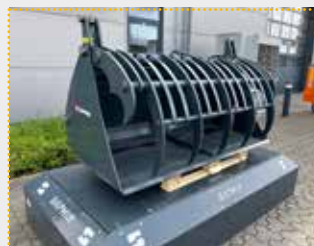
GS 20 Euro Greifschaufel

Lagermaschine Bj. 2023; passend für Euroaufnahme; Breite 2.000 mm; Öffnungsweite 1.450 mm; Inhalt 1.080 l; Farbschäden