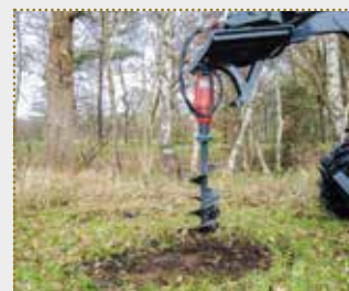
Erdborner Greif 303 H

Lagermaschine Bj. 2023, leichte Farbschäden, hydraulischer Antrieb (erforderliche Ölmenge 40-60 ltr./min), Bohrkörper 300 mm • Euroaufnahme für Frontlader oder • Baggeraufnahme MS 01 / MS 03 / MS 08