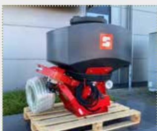
Kleinsamenstreuer DrillStar 300H

inkl. 2-Kreis-Druckluftbremse: 12.450,- €