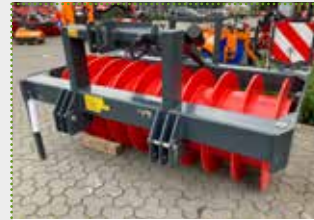
SW 25 Silagewalze

Lagermaschine Bj. 2022; Dreipunktaufnahme Kat. II/III; Arbeitsbreite 2.350 mm; Gesamtbreite 2.500 mm; Leergewicht ca. 1.795 kg; Gewicht befüllt ca. 2.575 kg; Farbschäden