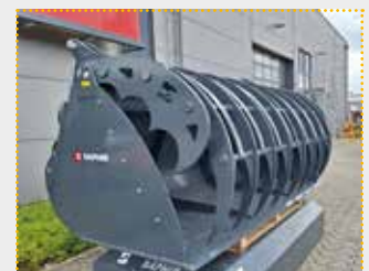
GSR 30 VLS Greifschaufel

Messemaschine Bj. 2024; Fahrzeugaufnahme frei wählbar per SAPHIR VLS; Breite 3.000 mm; Öffnungsweite 1.950 mm; Inhalt ca. 4.100 l; erhöhte Schaufelseitenenteile; Druckbegrenzungsventil