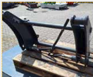
Adapterrahmen Euro / Volvo L70

Lagermaschine Bj. 2023; Fahrzeugaufnahme Euroaufnahme; Geräteaufnahme Volvo L50-L120; Farbschäden