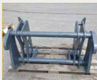
Adapterrahmen Volvo L30 / Volvo L20

Lagermaschine Bj. 2022; Fahrzeugaufnahme Volvo L30/Claas Torion/CAT/Case/Liebherr/Zettelmeyer; Geräteaufnahme Volvo L20/JCB 406; Farbschäden