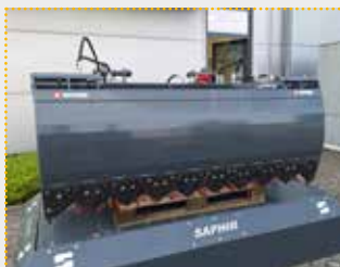
SSZ 199 SL VLS Silageschneidzange

Lagermaschine Bj. 2023; Fahrzeugaufnahme frei wählbar per SAPHIR VLS; Breite 1.990 mm; ausgestattet mit Schwerlastzinken; Öffnungsweite 850 mm; Inhalt ca. 1.350 l; Gewicht ca. 905 kg