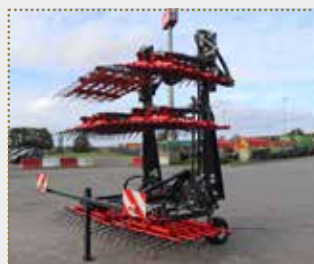
Ackerstriegel WeedStar 900 inkl. hydr. Zinkenverstellung

Lagermaschine Bj. 2023, Farbschäden, Arbeitsbreite: 9,0 m, Gewicht: 1.250 kg, 7 mm Zinkenstärke, serienmäßige Stützräder, hydraulische verstellbare Zinkenaggressivität, Beleuchtung inkl. Warntafel