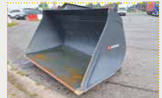
SGR 24.2 VLS Schwergutschaufel

Vorführmaschine Bj. 2021; Fahrzeugaufnahme frei wählbar per SAPHIR VLS; Breite 2.400 mm; Inhalt 2.600 l Wassermaß; Eigengewicht ca. 920 kg; Farbschäden