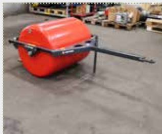
Rasenwalze Robust 100 K

Ausstellungsmaschine Bj. 2022; Arbeitsbreite: 100 cm; Trommeldurchmesser 81 cm; Abstellstütze; Abstreifer; Wassereinfüllstutzen