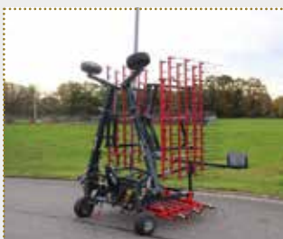
Ackerstriegel WeedStar 600

Lagermaschine Bj. 2023, leichte Farbschäden, Arbeitsbreite: 6,0 m, Gewicht: 615 kg, 7 mm Zinkenstärke, serienmäßige Stützräder, hydraulische verstellbare Zinkenaggressivität, Beleuchtung inkl. Warntafel