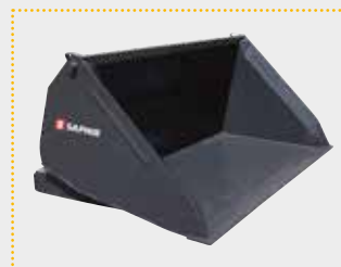
HK 20 Euro Hochkippschaufel

Lagermaschine Bj. 2022; Euroaufnahme; Breite 2.000 mm; Hubhöhengewinn ca. 1.000 mm; Inhalt ca. 1.100 l; leichte Farbschäden