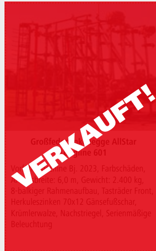
Großfederzinkenegge AllStar inkl. Impulsschiene 601

Vorführmaschine Bj. 2023, Farbschäden, Arbeitsbreite: 6,0 m, Gewicht: 2.400 kg, 8-balkiger Rahmenaufbau, Tasträder Front, Herkuleszinken 70x12 Gänsefußschar, Krümmerwalze, Nachstriegel, Serienmäßige Beleuchtung