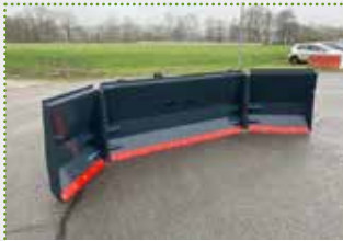
Kompakt 5001 Mais- und Grüngutschiebeschild

Lagermaschine Bj. 2023; Dreipunktaufnahme Kat. II/III; Arbeitsbreite 5.000 mm; Schildhöhe ohne Gitteraufsatz 1.100 mm; Schildhöhe mit Gitteraufsatz 1.500 mm; Kraftbedarf 150 PS; Eigengewicht 990 kg; leichte Farbschäden