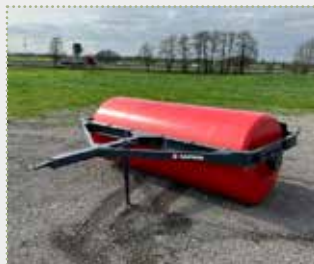
Wiesenwalze Robust 300

Lagermaschine Bj. 2023, leichte Farbschäden, Arbeitsbreite: 2,93 m, durchgehende Welle, Wassereinfüllstutzen, gefederter Abstreifer, Trommel-Ø: 123 cm, Leergewicht ca. 2.010 kg, Gewicht gefüllt ca. 4.990 kg