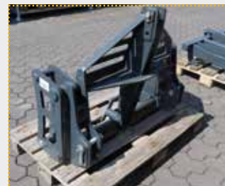
Adapterrahmen Kat. II / Volvo L40

Lagermaschine Bj. 2023; Dreipunktaufnahme Kat. II; Geräteaufnahme Volvo L40; Farbschäden