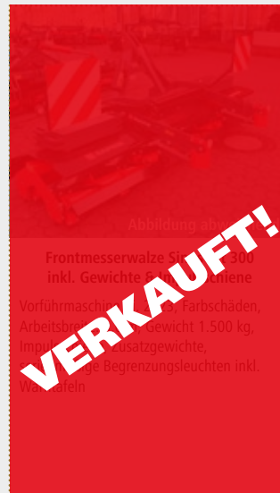
Frontmesserwalze SinusCut 500 inkl. Impulsschiene

Vorführmaschine Bj. 2023, Farbschäden, Arbeitsbreite: 5,0 m, Gewicht: 1.500 kg, Impulsschiene, serienmäßige Begrenzungsleuchten inkl. Warntafeln