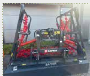
Grünlandegge Perfekt 502 S4 Hydro

Lagermaschine, Bj. 2023, leichte Farbschäden, Arbeitsbreite: 5,00 m, 4-reihig mit S-Gussstern, Dreipunktanbau Kat. II, hydr. Klappung (1 x dw), Stabile Klappscharniere