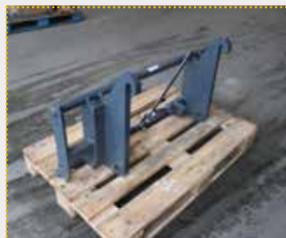
Adapterrahmen JCB 406 / Euro

Lagermaschine Bj. 2023; Fahrzeugaufnahme JCB 406/Volvo L20; Geräteaufnahme Euro; Farbschäden