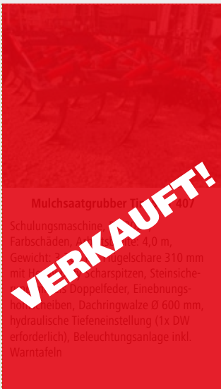
Mulchsaatgruber TineStar 307

Schulungsmaschine Bj. 2023, Farbschäden, Arbeitsbreite: 4,0 m, Gewicht: 1.500 kg, Flügelschare 310 mm mit Herkuleszinkenspitzen, Steinsicherungen, Doppelfeder, Einebnungshohlscheiben, Dachringwalze Ø 600 mm, hydraulische Tiefeneinstellung (1x DW erforderlich), Beleuchtungsanlage inkl. Warntafeln