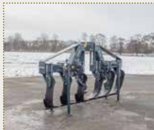
Tiefenlockerer PlowStar Combi

Schulungsmaschine Bj. 2023, Farbschäden, Arbeitsbreite: 4,0 m, Gewicht: 1.500 kg, Flügelschare 310 mm mit Herkuleszinkenspitzen, Steinsicherungen, Doppelfeder, Einebnungshohlscheiben, Dachringwalze Ø 600 mm, hydraulische Tiefeneinstellung (1x DW erforderlich), Beleuchtungsanlage inkl. Warntafeln