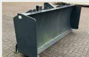
MGS 2505 Mais- und Grüngutschiebeschild

Lagermaschine Bj. 2023; Dreipunktaufnahme Kat. II/III; Breite 2.500 mm; Höhe ohne Gitteraufsatz 1.000 mm; Leergewicht ca. 690 kg; Gewicht befüllt ca. 1.140 kg; Farbschäden