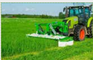
SaMASZ Frontscheibenmäher KDF 301 S

Lagermaschine Bj. 2022; min. 100 PS Kraftbedarf; 3,00 m Arbeitsbreite (je Gerät) PerfectCut-Mähbalken; Zinkenaufbereiter Sicherheitsmodul safeGEAR; Gehärtete Gleitkufen; Stufenlose Schnitthöhenverstellung