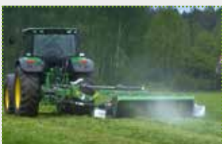
SaMASZ Heckscheibenmäherwerk KT 301 SH

Lagermaschine Bj. 2022; min. 100 PS Kraftbedarf; 3,00 m Arbeitsbreite (je Gerät); PerfectCut-Mähbalken; Zinkenaufbereiter Sicherheitsmodul safeGEAR; Gehärtete Gleitkufen; Stufenlose Schnitthöhenverstellung; Hydraulische Anfahrtsicherung