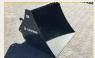
LG 11 Euro Leichtgutschaufel

Lagermaschine Bj. 2023; Euroaufnahme; Breite 1.100 mm; Inhalt 410 l gestrichen nach DIN; Inhalt 530 l gehäuft nach SAE; Farbschäden