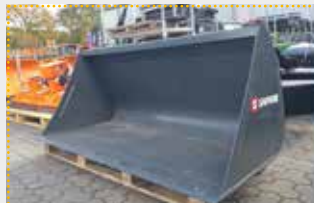
LG 19 Schäffer mech. Leichtgutschaufel

Lagermaschine Bj. 2024; Fahrzeugaufnahme Schäffer U-Profil mechanisch; Breite 1.900 mm; Inhalt 740 l gestrichen nach DIN; Inhalt 960 l gehäuft nach SAE; Farbschäden