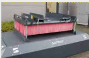
KB 15 Kehrbesen

Lagermaschine Bj. 2022; Gabelzinkenaufnahme 130x60 mm; Arbeitsbreite 1.495 mm; 12 Bürstenreihen; Abstellstützen; Farbschäden