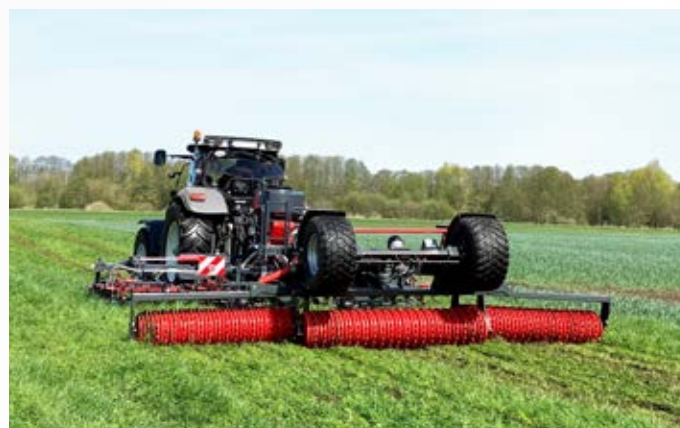
Konturstriegel Perfekt KS 600 mit angehangener Cambridgewalze

Der Konturstriegel KS passt sich durch die parallelogrammgeführten Striegelfelder und frei beweglichen Auslegearme auch bei stark kupiertem Gelände optimal an die Bodenkonturen an. Das 4-reihige Striegelfeld mit geringem Strichabstand gewährt eine hohe Bearbeitungsdichte bei gleichzeitig hohem Materialdurchgang. Die Zinken können 40° in ihrer Neigung eingestellt werden, wobei die beiden hinteren Reihen noch zusätzlich flacher im Winkel eingestellt werden können. Die stabile Rahmenausführung lässt die Kopplung einer Anhängewalze zu und erweitert die Möglichkeiten des Gerätes.