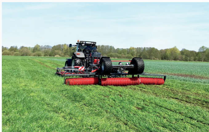
Konturstriegel Perfekt KS 600 mit angehangener Cambridgewalze

Der Konturstriegel KS passt sich durch die parallelogrammgeführten Striegelfelder und frei beweglichen Auslegearme auch bei stark kupiertem Gelände optimal an die Bodenkonturen an. Das 4-reihige Striegelfeld mit geringem Strichabstand gewährt eine hohe Bearbeitungsdichte bei gleichzeitig hohem Materialdurchgang. Die Zinken können 40° in ihrer Neigung eingestellt werden, wobei die beiden hinteren Reihen noch zusätzlich flacher im Winkel eingestellt werden können. Die stabile Rahmenausführung lässt die Kopplung einer Anhängewalze zu und erweitert die Möglichkeiten des Gerätes.